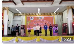
วิดีโอของ สำนักงานสาธารณสุขอำเภอ แม่สาย 4 ปีที่แล้ว · การรับชม 611 ครั้ง 👍👎 5