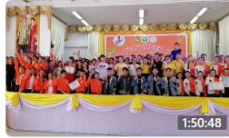
To Be Number One ครั้งที่3 รอบชิงชนะเลิศ อำเภอแม่สาย 4 ปีที่แล้ว · การรับชม 275 ครั้ง 👍👎 11