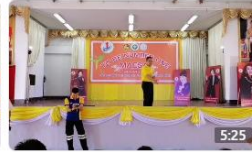
To Be Number One ครั้งที่3 รอบชิงชนะเลิศ อำเภอแม่สาย 4 ปีที่แล้ว · การรับชม 169 ครั้ง 👍👎 2